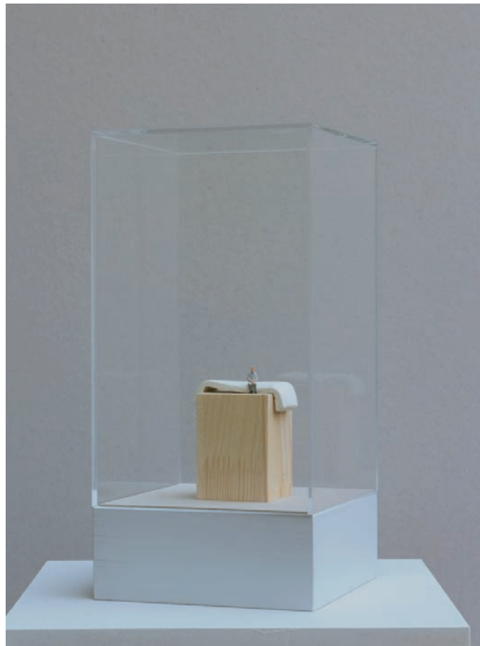
EINE BRÜCKE VON GEDANKE ZU GEDANKE 2013 Ausschnitt aus IST DENKEN FORM Projekt mit dem Team einer IT-Firma Vitrine mit Holzsockel, Gipsform und Modellfigur, Text

... und ich bin aufmerksam und offen für Unbekanntes.