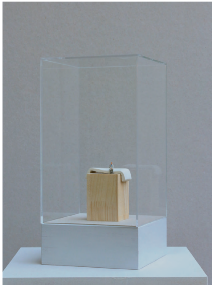
EINE BRÜCKE VON GEDANKE ZU GEDANKE 2013 Ausschnitt aus IST DENKEN FORM Projekt mit dem Team einer IT-Firma Vitrine mit Holzsockel, Gipsform und Modellfigur, Text

... und ich bin aufmerksam und offen für Unbekanntes.